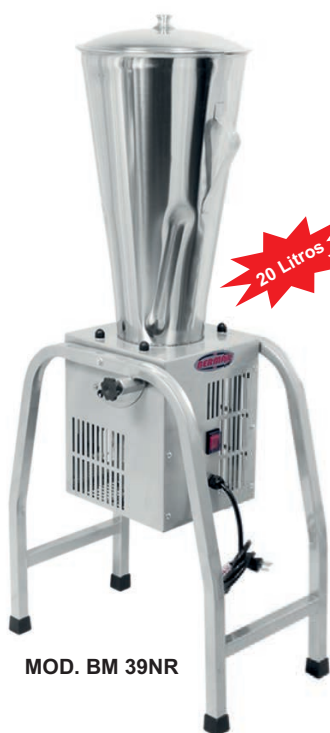
MOD. BM 39NR