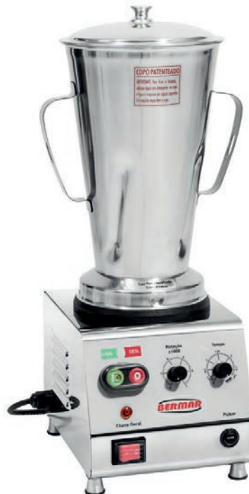
BM 123 NR (4 Litros)

Você determina o tempo, e a máquina desliga automaticamente ou pode trabalhar, desligando quando você quiser.