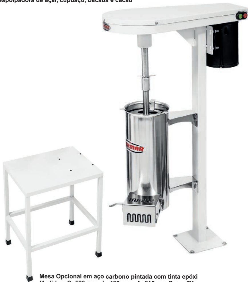
Mesa Opcional em aço carbono pintada com tinta epóxi Medidas: C- 520 mm L- 400 mm A- 615 mm Peso: 7Kg

despolpadora de açaí, cupuaçu, bacaba e cacau