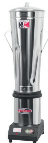
BM 36NR (10 Litros)