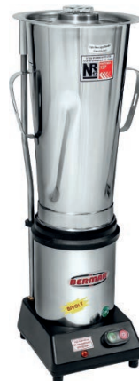
BM 35NR - S (8 Litros)