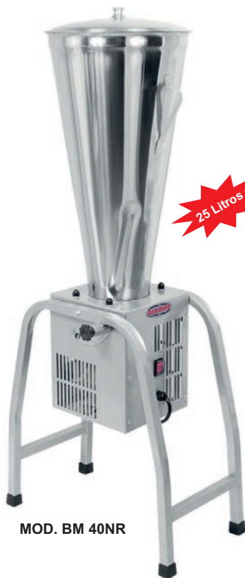
MOD. BM 40NR