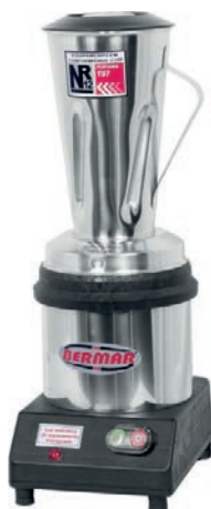
BM 42/48 (2 Litros)