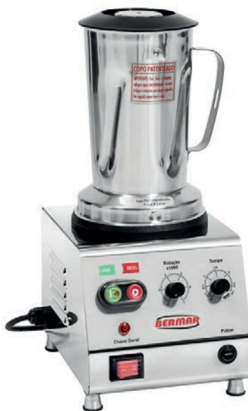
BM 100 NR (2 Litros)

Agora, você tem um produto de baixa e alta rotação no mesmo equipamento.