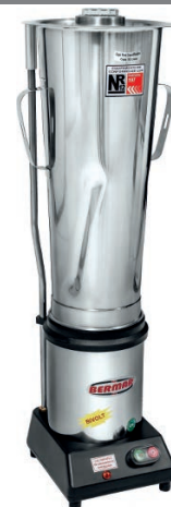
BM 36NR - S (10 Litros)