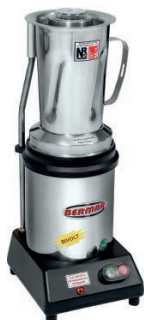
BM 30NR - S (2 Litros)