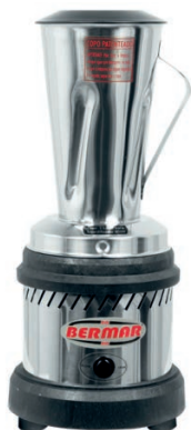
BM 41/47 ( 2 Litros)