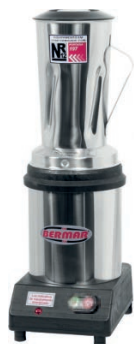
BM 30NR (2 Litros)