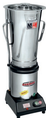
BM 32NR - S (6 Litros)