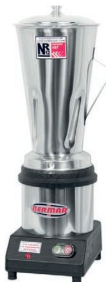
BM 43/49 ( 4 Litros)