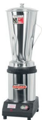
BM 31NR (4 Litros)