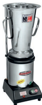
BM 31NR - S (4 Litros)