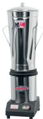
BM 32NR (6 Litros)